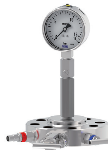
FIGURA 6. Manómetro con restricción, sifón compacto y monobrida