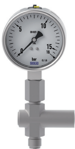
FIGURA 3. Manómetro con protección contra sobrepresiones