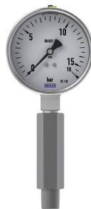
FIGURA 5. Manómetro con sifón de diseño compacto