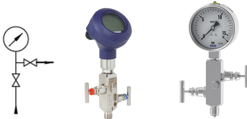
FIGURA 1. Transmisor de proceso y manómetro, montados sobre una válvula de aguja «block-and-bleed» (aislamiento y purga).

Otra de las aplicaciones típicas de las válvulas de aguja es la medición de presiones diferenciales, por ejemplo en la monitorización de filtros y bombas. Para satisfacer esta necesidad correctamente se dispone de bloques de válvulas (manífolds) específicos; los manífolds de una vía para manómetros diferenciales sirven únicamente para compensar la presión entre las dos conexiones de entrada; este diseño se utiliza para comprobar el punto cero o para ajustar el instrumento. En los manífolds de tres vías, en cambio, cada línea del proceso se puede aislar independientemente para, por ejemplo, retirar y cambiar un instrumento. Los manífolds de cinco vías disponen de dos salidas adicionales que permiten ventear las conexiones de presión, una vez aisladas entre sí (Figura 2).