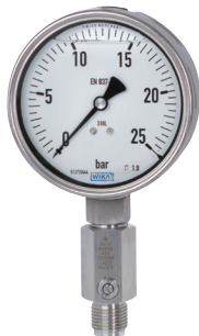
FIGURA 4. Manómetro con amortiguador exterior