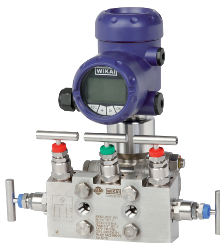
FIGURA 2. Transmisor de proceso con manifold de cinco vías